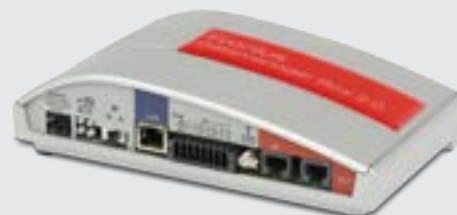
/ Fronius Datamanager Box 2.0

/ Komfortabler Support da der Fronius Datamanager den Wechselrichter direkt mit Fronius Solar.web verbindet.